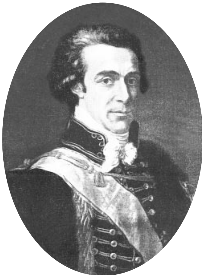
Axel von Fersen d.y. Målning av P. Dreuillon, Düsseldorf, omkr. 1799. Lövstad.